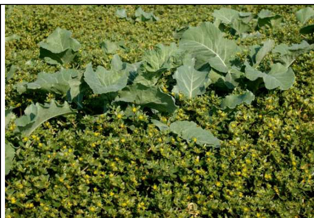
Abb.2: Portulak überwuchert Kohlbestand (Schlaghecken)

Portulak hat sehr kleine, gelbe Blüten (Abb. 3) und bringt viele kleine schwarze Samen, die nur einen Durchmesser von 0,5-1,0 mm haben (Abb. 4). Eine Pflanze kann tausende von Samen ausbilden. Portulak gilt als Sommerkeimer, ist wärmeliebend und blüht vorwiegend von Juli bis Oktober. Bei 20°C benötigt er zur Keimung rund 7-10 Tage.