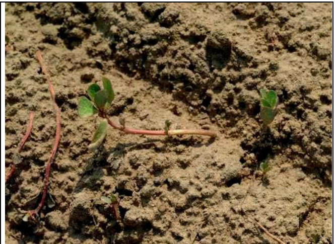
Abb. 8: Einige Triebe wachsen weiter (Schlaghecken)

Wegen der schwierigen Bekämpfung ist eine vorbeugende Feldhygiene besonders gefragt. Ideal ist es, wenn die Pflanzen vor der Samenreife vernichtet werden. Offensichtlich ist Portulak während der Keimung empfindlich gegen hohe Salz- und Ammoniumgehalte im Boden. Möglicherweise kann man durch eine Düngung auf das fertige Pflanzbeet eine Keimstörung bewirken.