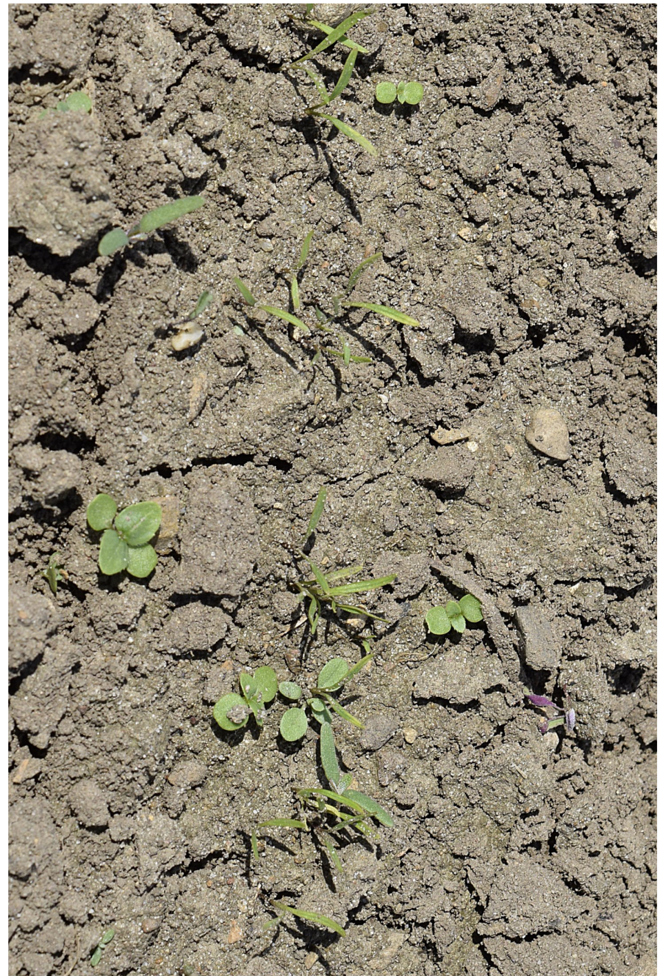
Zwei- bis Vierblattstadium