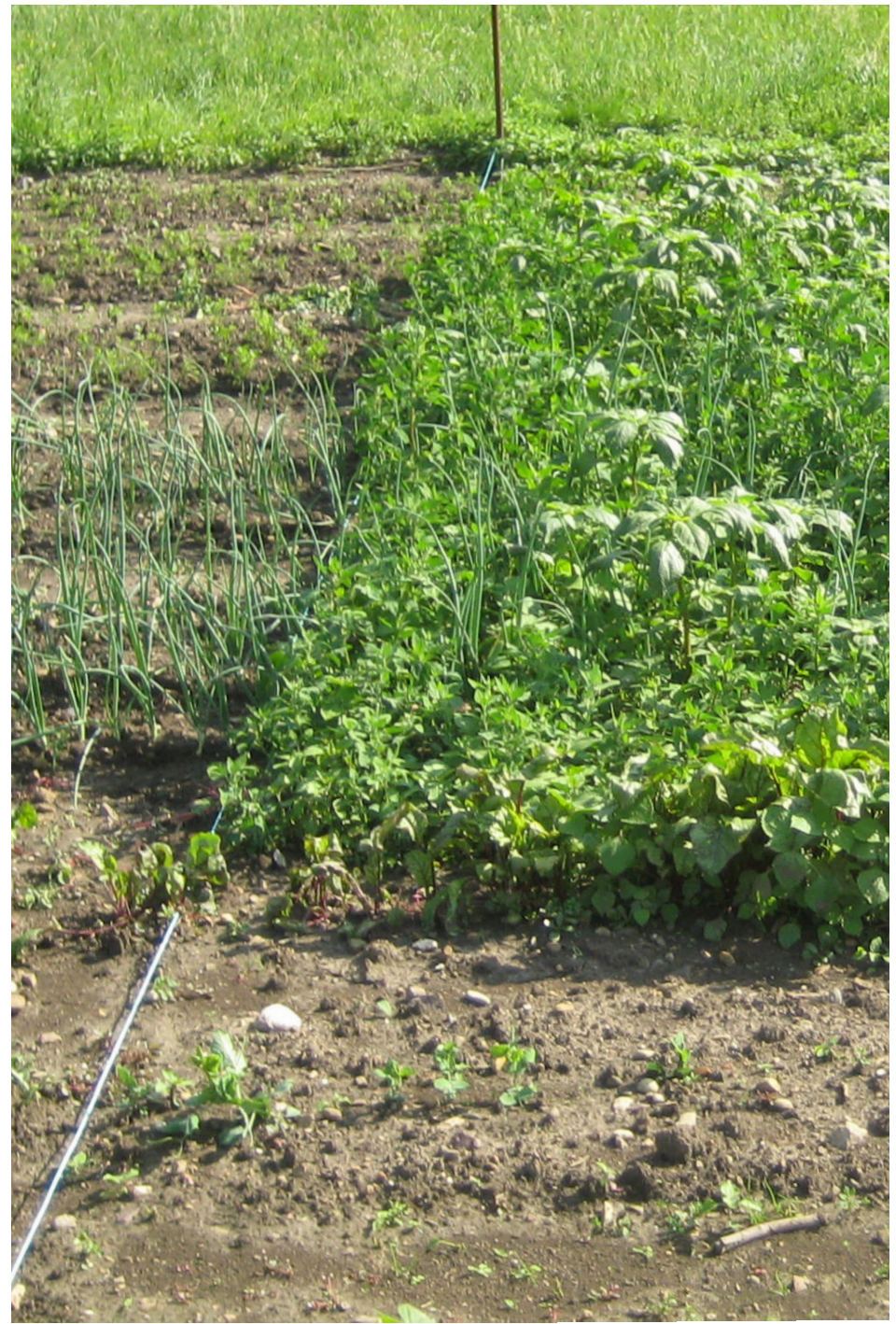
Vier Wochen nach der Übergabe