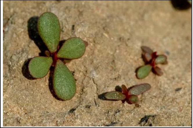
Abb. 6: Keimlinge, meist rot überlaufen (Schlaghecken)