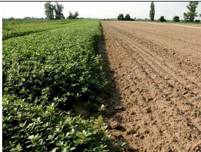
Abb. 7: Reinbestand mechanisch bekämpft (Kreiselmaier)

Unter anderem in den USA ist Portulak auch im Gemüsebau schon länger ein großes Problem. Wegen der schwierigen Bekämpfung empfiehlt man alles zu tun, um eine Erstbesiedlung einer Parzelle zu vermeiden. Auch im Ökoanbau macht Portulak Schwierigkeiten weil er z.B. nach einem Abflammen gerne wieder durchtreibt. Um das Problem in den Griff zu bekommen bzw. in erträglichen Grenzen zu halten, sollte ein Aussamen unbedingt verhindert werden. Mechanisch bekämpfte Pflanzen können jedoch nach einer Bewässerung leicht wieder anwachsen (Abb. 7 und 8).