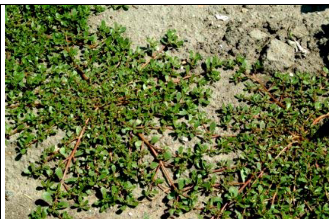
Abb.1: Typisch am Boden kriechend (Schlaghecken)

Portulak (Abb. 1) wird im Gemüsebau der wärmeren Regionen, wie der Pfalz, immer mehr zu einem Problem. Auf einzelnen Parzellen steht das Unkraut schon in Reinkultur (Abb. 2). Botanisch gesehen handelt es sich um Portulaca oleracea , einer Pflanzenart aus der Familie der Portulakgewächse. Die flach über den Boden wachsende Pflanze hat dicke fleischige Stängel und Blätter und gehört zu den Blattsukkulente. Es handelt sich um eine einjährige Pflanze, die meist nicht höher als 10 cm wird. Bei einem sehr dichtem Bestand (Abb. 2) erreicht sie aber auch eine Höhe von über 25 cm. Eine einzelstehende Pflanze kann aber durchaus rund 50 cm über den Boden dahin kriechen.