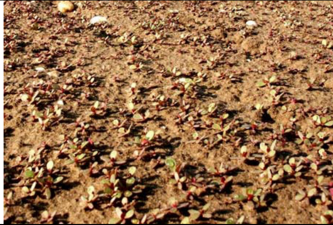
Abb. 5: Portulak-Unkraut, wie gesät (Kreiselmaier)

Bevorzugt werden nährstoffreiche, sandige Böden. In der Pfalz gibt es Parzellen auf denen nach der Saatbeetbereitung Portulak in Reinkultur aufläuft (Abb. 5). Der Boden ist dabei mit hunderten von Keimlingen pro qm besetzt. Wie die Abb. 6 zeigt, sind die Keimlinge, ebenso wie später auch die ganze Pflanze, recht fleischig. Insbesondere die Stängel sind meist rötlich.