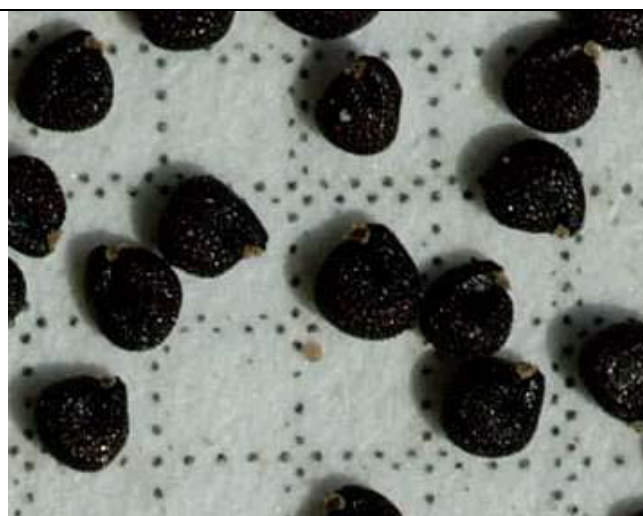
Abb. 4) Die schwarzen Samen auf Millimeterpapier (Schl.)