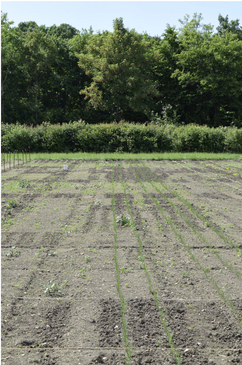
Zwei Wochen nach der Übergabe