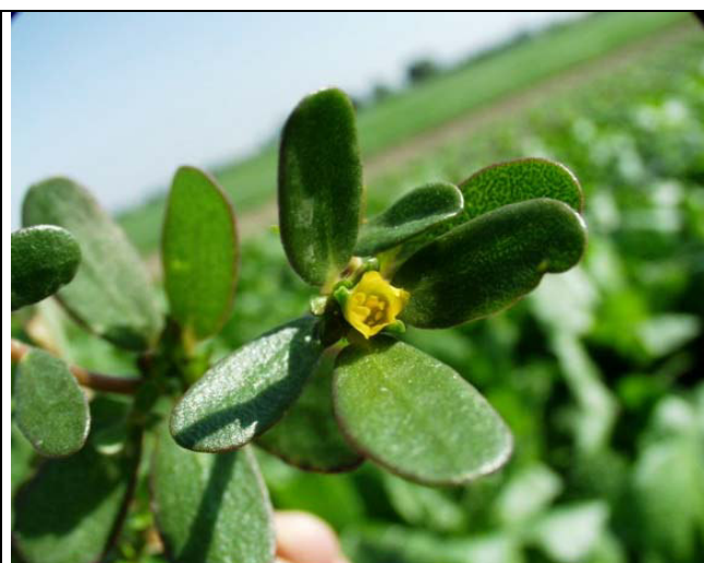
Abb. 3: Portulak Blüte (Kreiselmaier)

Portulak hat sehr kleine, gelbe Blüten (Abb. 3) und bringt viele kleine schwarze Samen, die nur einen Durchmesser von 0,5-1,0 mm haben (Abb. 4). Eine Pflanze kann tausende von Samen ausbilden. Portulak gilt als Sommerkeimer, ist wärmeliebend und blüht vorwiegend von Juli bis Oktober. Bei 20°C benötigt er zur Keimung rund 7-10 Tage.